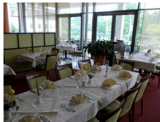
Restaurant Theodor Storm