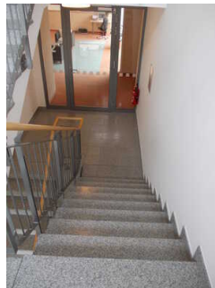
Treppe alle Etagen alternativ zu Aufzug alle Etagen