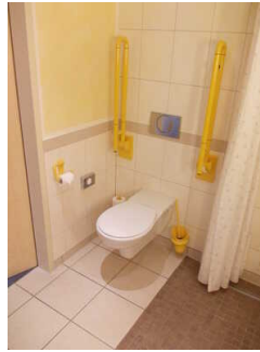
WC mit Haltegriffen Zimmer Nr. 328