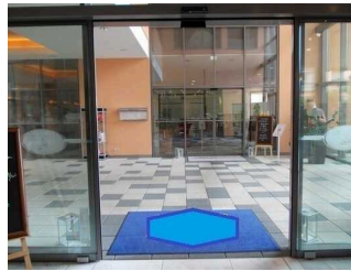
Automatiktür zur Rezeption