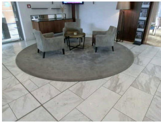
Rezeption und Hotel-Lobby

Wir haben für Sie einige Fotos aus dem Betrieb / Angebot zusammengestellt. In den Detailberichten finden Sie weitere Fotos.