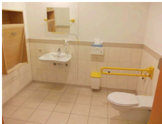
Öffentliches WC für Menschen mit Behinderungen 1.Etage