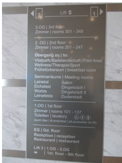
visuell taktile Gestaltung und Wegweiser