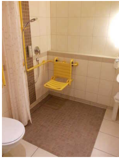
Dusche im Zimmer Nr. 328