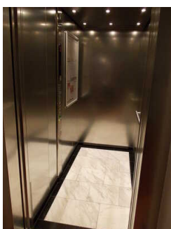
Aufzug zu den Zimmeretagen 1-5