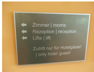
visuell taktile Gestaltung und Wegweiser