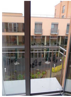
Balkon am Schlafraum Zimmer Nr. 328