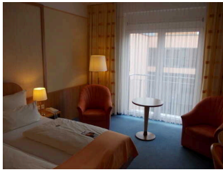
Schlafraum Zimmer Nr. 328