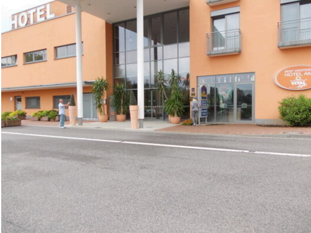
Hotel am Vitalpark in Heilbad Heiligenstadt