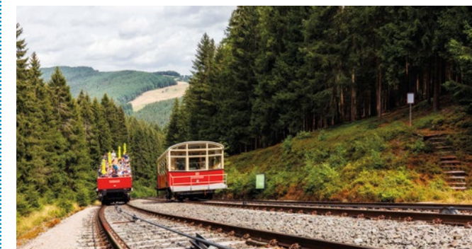
[Oben] Rundweg auf dem Lerchenberg in Zella-Mehlis [Mitte] Barrierefreies Skivergnügen mit ausgeliehenem Sitzschlitten in Oberhof [Unten] Erlebnis Thüringer Bergbahn im Schwarzatal