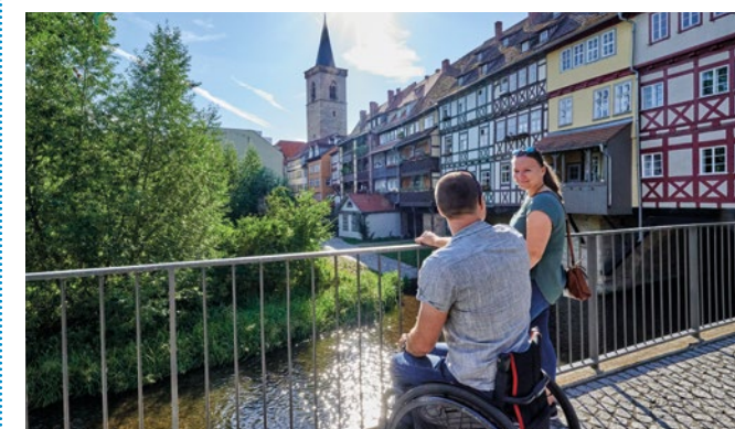
[Oben] Barocke Stadtfestung Zitadelle Petersberg [Mitte] Tastmodell vor dem Erfurter Rathaus [Unten] An der Krämerbrücke